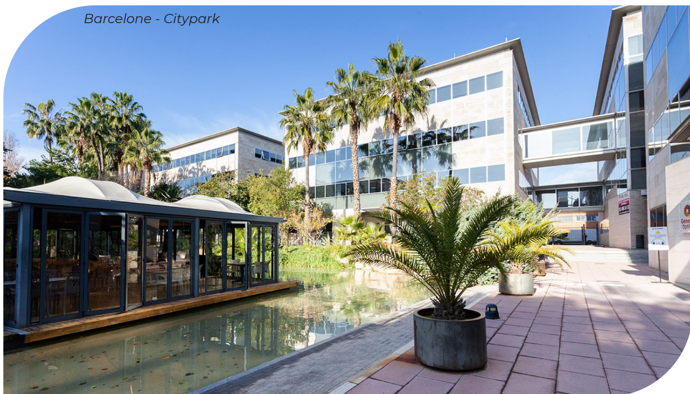
Barcelone - Citypark